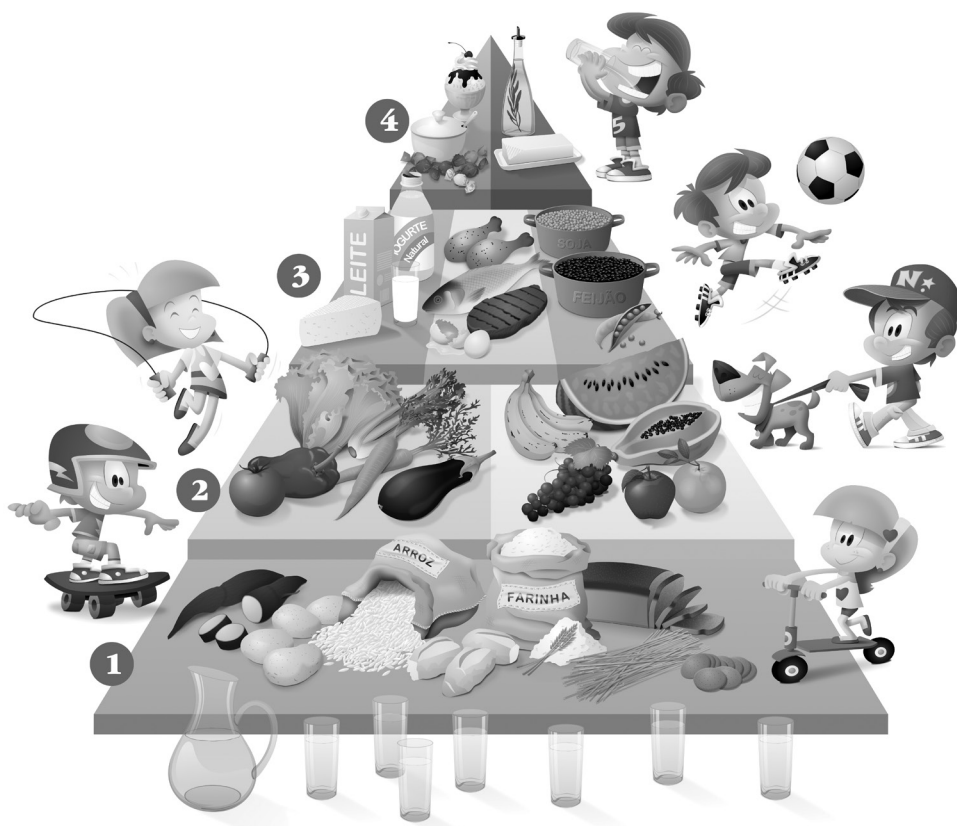
Figura 1. Pirâmide Alimentar.